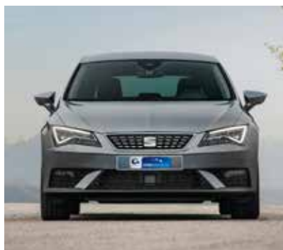
Model po liftingu (po 2016 r.)

Auto jest przestronne i komfortowe. Wnętrze pozbawione jest jakichkolwiek ekstrawagancji i uduziwień – wszystko obsługuje się intuicyjnie, a materiały użyte do wykończenia kabiny w zasadzie nie dają powodów do narzekań.