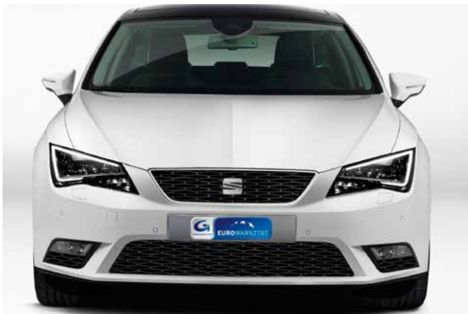
Seat Leon III dzieli większość rozwiązań technicznych ze Skodą Octavią III oraz VW Golfem VII

Seat Leon trzeciej generacji ustępuje popularnością spokrewnionej Octavii III oraz VW Golfowi VII. Ale to równie dobra konstrukcja, na dodatek w ogłoszeniach trafiają się okazje cenowe.