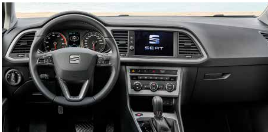
Wnętrze - czytelne i starannie wykonane.

Wszystkie silniki mają turbodoładowanie i bezpośredni wtrysk, co podnosi koszty ewentualnego montażu instalacji gazowej. Realnie nie jest ona jednak niezbędna, ponieważ podstawowe jednostki 1.0 TSI, 1.2 TSI czy najpopularniejszy 1.4 TSI rozsądnie obchodzą się z paliwem. Trzeba się tylko nauczyć odpowiedniej techniki jazdy – „głaskania” pedału gazu przy stałej prędkości, by bezpośredni wtrysk paliwa mógł ujawnić swoje największe za-